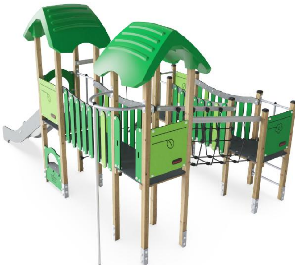
Figur 4. Illustration af legetårn.